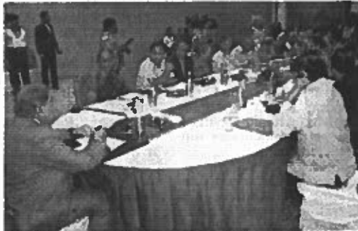
Finance Commission of India holds the third consultation with economists in Chennai, led by chairman of XV Finance Commission Dr N.K.Singh.

Inter-district disparities, unplanned urbanisation and resulting migration, disparity in funds flow between rural and urban local bodies, were among the key